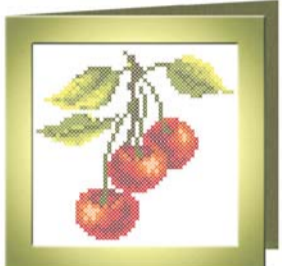
Схема разработана компанией «Марья Искусница» с помощью мулине FINCA PRESENCIA.