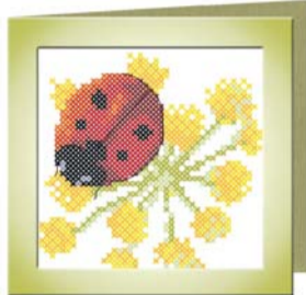
Схема разработана компанией «Марья Искусница» с помощью мулине FINCA PRESENCIA.