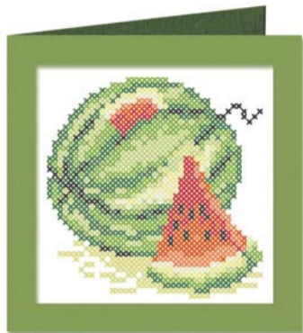
Схема разработана компанией «Марья Искусница» с помощью мулине FINCA PRESENCIA.

Подробная информация на сайте www.formularukodeliya.ru , в журнале и по телефону: +7(495)6617588