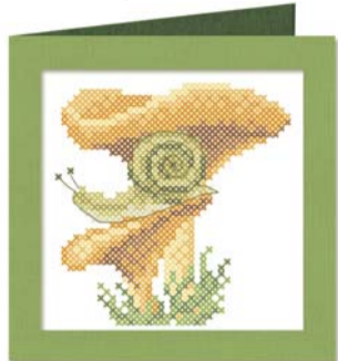
Схема разработана компанией «Марья Искусница» с помощью мулине FINCA PRESENCIA.

Подробная информация на сайте www.formularukodeliya.ru , в журнале и по телефону: +7(495)6617588