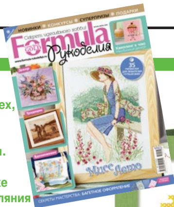
Схема разработана компанией «Марья Искусница» с помощью мулине FINCA PRESENCIA.

Подробная информация на сайте www.formularukodeliya.ru , в журнале и по телефону: +7(495)6617588